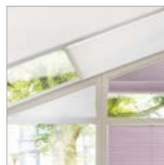
im Plafondbereich (schräg / horizontal) möglich